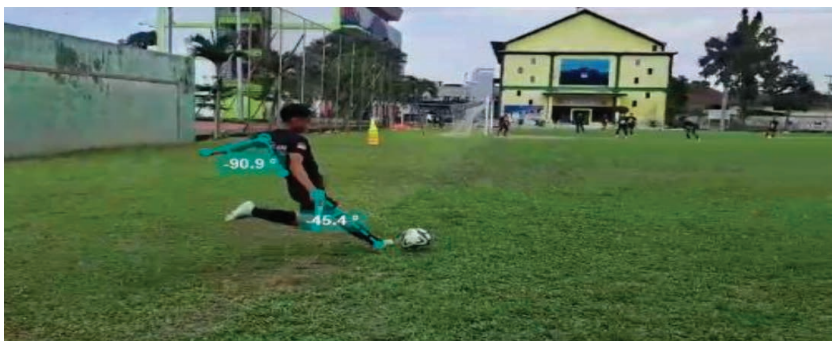
Gambar 12. Corner kick

Sesuai dengan tujuan sepak bola yaitu menciptakan gol ke gawang lawan, tentunya momen ini juga dapat digunakan menjadi senjata yang ampuh bahkan bisa dikatakan sangat krusial untuk membahayakan tim lawan (foto lokasi service : right corner , left corner , free kick sisi kanan gawang dan free kick sisi kiri gawang. Berkaitan dengan service , untuk dapat mengancam gawang lawan. Pelatih harus menunjuk satu, dua atau tiga pemain yang menjadi algojo dalam mengeksekusi “ service ” yang dimaksud. Tentunya pemain tersebut memiliki kualitas tendangan yang baik, (selanjutnya dibalik tendangan yang berkualitas ada pengaruh besar dari kekuatan engkel, posisi badan dan factor dari biomekanika dan kinesiologi).